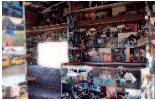
Campingmamma er omsorgfull og godhjertet. Inne i Campingmamma finnes øyeblikksbilder fra campinglivet i England, Tyskland, Norge og Nederland.

Reykjavik Art Festival, i tillegg til at de ble utstilt i sentrum av den islandske hovedstaden. 17. mai. I strålende solskinn, satte campingkvinnene sitt preg på den norske feiringen utenfor Nordens Hus.