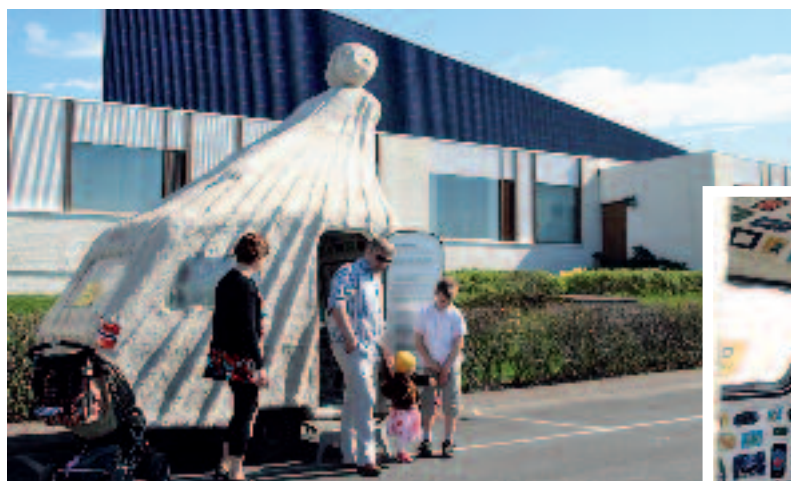
Flyktningekvinnen bærer på mange vonde minner, og vekker undring og nysgjerrighet blant dem som besøker henne. Relieffene inni vogna forteller hva skolebarna ville hatt med seg hvis de måtte flykte, og hva flyktningekvinnene tok med seg da de flyktet.

– Vi har samarbeidet siden 1995, og musikken er en stor del av opplevelsen for å underbygge de ulike kvinneskikkelsene, sier hun.