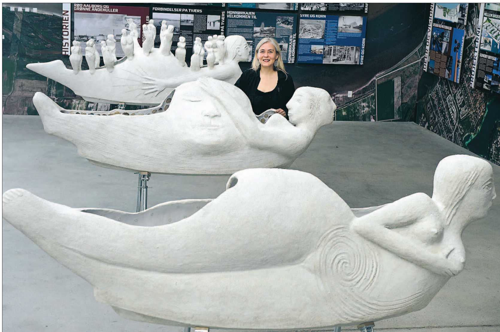
FOR TIDEN kan man se "Life-Boats" i modelform i Utzon-Centret i Aalborg.