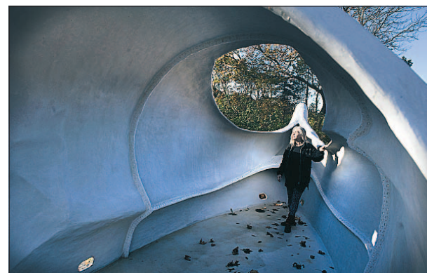
Der er plads til passagerer i skibene, der skal sejle Europa rundt.

specialværktøj, som også kan bruges til de næste skibe, forklarer Benthe Norheim.