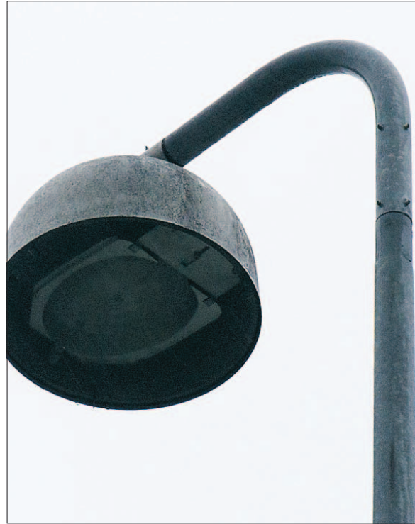
I den mørke vintertid, slukker masterne i Lønstrup-området klokken 22.

Telefon 99245111 E-mail hjoerring@nordjyske.dk Adresse Frederikshavnsvej 81, 9800 Hjørring