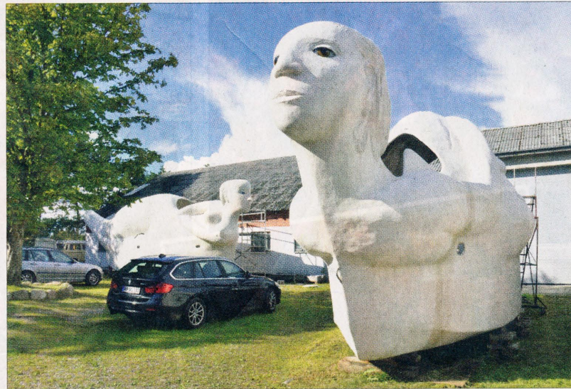
Udenfor den store hal, hvor båden er blevet støbt i ferrocement, står to af de tre skulpturbåde i projektet - næsten klar til afgang på deres mission. De er formet som, kvinder på forskellige stadier i livet og de har henholdsvis fået navnene Længsel og Liv.

Udenfor den store halv, hvor præsentationen foregik, står to af de tre skulpturbåde i projektet - næsten klar til afgang på deres mission. De er formet som, kvinder på forskellige stadier i livet, og de har henholdsvis fået navnene Længsel og Liv.