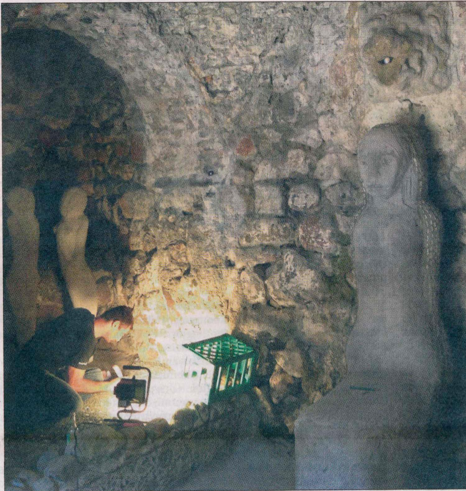
I Kildegrotten finder man flere forskellige skulpturer støbt i beton.

- Hun var alene med fire børn og begyndte at fejle stjerne i Søndermarken, og senere blev hun kildekone og solgte kildevand sammen med sine digte. Her fik hun plads til at udfolde sin kunstneriske side. Selv om Marie Villads