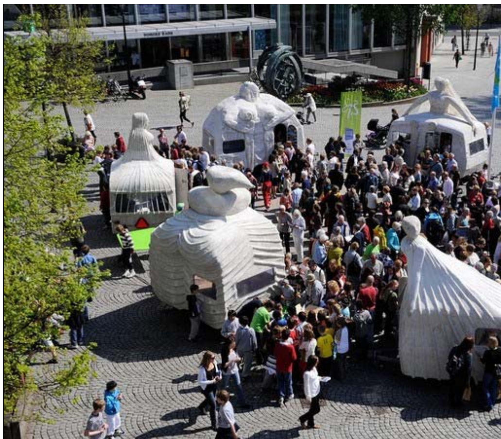
Campingkvinnene satte tirsdag sitt preg på Stavanger sentrum.